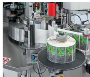
CG 80 XPS