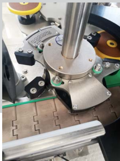
Stella entrata/uscita multiformato Multiformat in/out star wheel Stoile entrée/sortie multiformats Estrella multiformato para entrada y salida Mehr-formatige Sterne am Ein-/Ausgang

Le macchine di questa serie pur essendo molto compatte consentono confezionamenti di grande precisione e qualità con rendimenti sino a 4.500 bott/h. I gruppi di etichettaggio RPS ed XPS azionati da motore passo-passo ed il sistema di controllo del posizionamento etichette rendono le CG 80 al vertice tecnologico della categoria. Queste macchine possono essere dotate di sistemi per la rullatura o la termoretrazione delle capsule, orientamenti meccanici ed inoltre possono essere combinate con stazioni a colla.