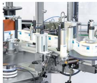
CG 80 RPS